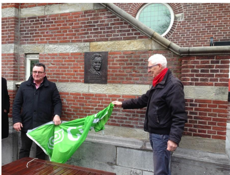
Onthulling plaquette Oud

Elke eerste zaterdag van de maand, vanaf 7 april tot en met 29 september is er een combiwandeling. Deze wandeling begint met een bezoek aan de Jan Stuyt-mini-expositie in het Purmerends Museum en vervolgens een wandeling door de stad, waar naast de werken van Stuyt, ook die van de in Purmerend geboren architecten Oud en Stam worden belicht. De wandeling wordt afgesloten met een kopje koffie of thee.