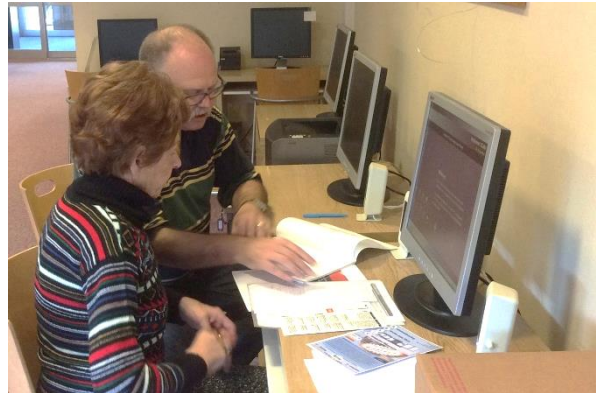
Internetcafé Jaap van Praag

In een Internetcafé worden de deelnemers vanaf vijftig plus door Gildevrijwilligers op een eenvoudige manier wegwijs gemaakt op de computer. De begeleiding omvat o.a. het gebruik van internet, email, tekstverwerking, mappenbeheer, foto's van fototoestel naar de computer etc.. Daarnaast wordt er nog steeds meer hulp en begeleiding gevraagd bij smartphones en tablets van de diverse merken met hun eigen besturingssysteem.